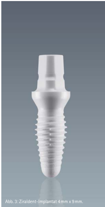
Abb. 3: Ziraldent-Implantat 4 mm x 9 mm.