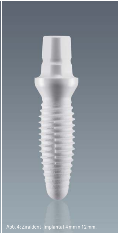
Abb. 4: Ziraldent-Implantat 4 mm x 12 mm.