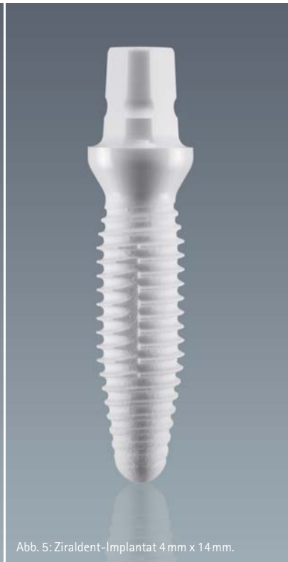
Abb. 5: Ziraldent-Implantat 4 mm x 14 mm.

dem Setzen der Implantate erfolgte die erste Nachuntersuchung. Weitere werden im jährlichen Rhythmus durchgeführt. Bei diesen Nachuntersuchungen werden neben der Festigkeit der Implantate auch Plaque- und Blutungsindex sowie weitere Weichgewebsparameter wie Sondierungstiefen und Gingivarezessionen notiert.