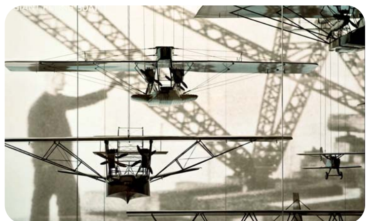
Das Dornier Museum in Friedrichshafen (DE).