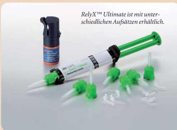
RelyX™ Ultimate ist mit unterschiedlichen Aufsätzen erhältlich.

licher Aktivator notwendig ist. Da Scotchbond Universal Adhäsiv außerdem die Funktion eines Silans sowie die eines Primers für Metall und Zirkoniumdioxid einnimmt, werden keine weiteren Komponenten benötigt. Dies führt nicht nur zu einem vereinfachten Handling, sondern auch zur Minimierung des Fehlerrisikos – und nicht zuletzt zu einer Reduzierung des Lagerbestandes. Das neue Befestigungscomposite wird in einer Automix-Spritze angeboten, für die