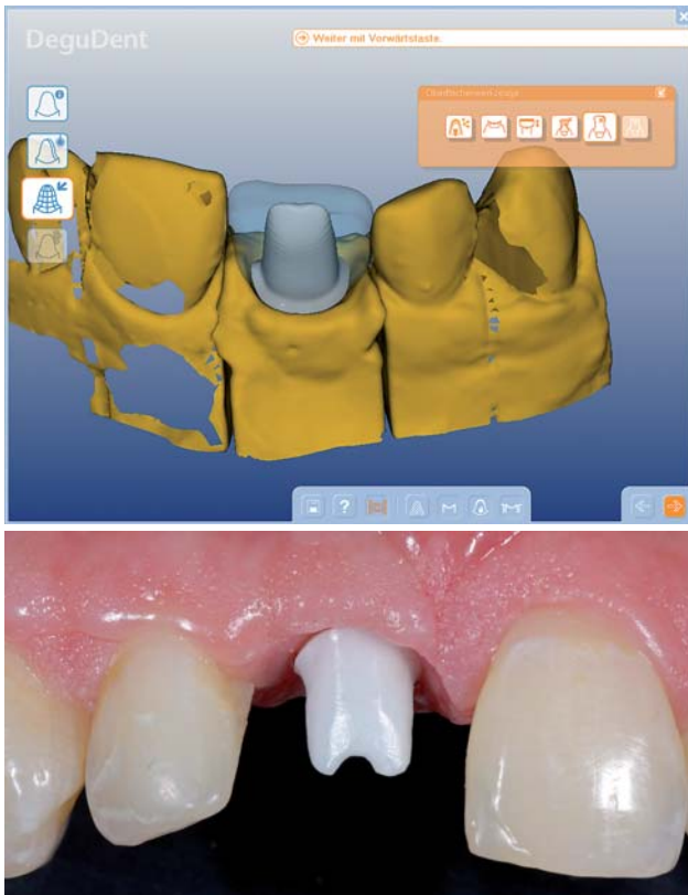
Abb. 5: Individuelles Design des Abutments mit Festlegung der Präparationsgrenze (Cercon Art, DeguDent GmbH, Hanau). – Abb. 6: Modifiziertes Design des Abutments mit tiefer liegender Präparationsgrenze, auf diese Weise wird eine Kronenform ermöglicht, die zur Kontur der Nachbarzähne passt.

Idealerweise wird mit dem Abutment eine leicht subgingivale Lage der Präparationsgrenze angestrebt. Eine tief subgingivale Positionierung der Präparationsgrenze hat den Nachteil, dass die spätere Entfernung von Zementresten erschwert wird. Andererseits ist beim Design des Abutments auch auf eine Harmonie der roten Ästhetik zu achten, die Weichgewebsausformung sollte also den Verlauf der benachbarten Zähne berücksichtigen. Wird dieser Aspekt vernachlässigt, entstehen bei der späteren Versorgung ein disharmonischer Verlauf der Weichgewebe und damit ein ästhetischer Kompromiss (Abb. 4). Für den Zahntechniker ist es also wichtig, Informationen zum Verlauf der Weichgewebe im gesamten Frontzahnbereich zu erhalten. Diese Informationen können einerseits durch den Scan des Arbeitsmodells in die CAD-Software übertragen werden. Häufig ist aber auch ein klinisches Foto sehr hilfreich, um das Abutmentdesign zu optimieren. Unter Umständen kann es sinnvoll sein, auch im Frontzahnbereich den Rand des Abutments gezielt etwas tiefer zu legen, um eine optimale Kontur im Durchtrittsbereich zu erzielen (Abb. 5 und 6). Auf jeden Fall ist eine Anprobe des Abutments zu empfehlen. Sofern es im Behandlungsverlauf zu einer Veränderung der Weichgewebe gekommen ist (zumeist wird es zu einer Schrumpfung oder Rezession kommen), kann bei der Anprobe das Abutment gezielt intraoral nachpräpariert werden.