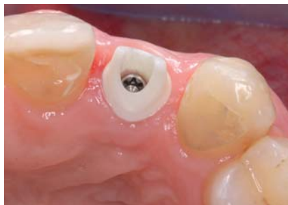
Abb. 1 und 2: Klinisches Anwendungsbeispiel für ein individuell gefertigtes Zirkonoxidabutment zur Versorgung eines Einzelzahnimplantates (Atlantis, Astra Tech, Elz).