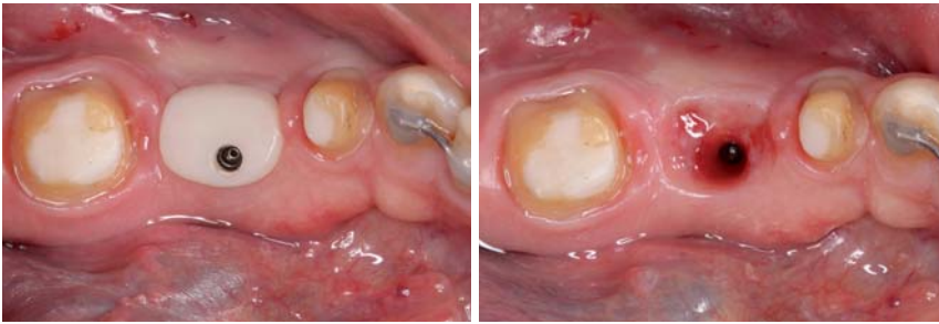
Abb. 7: Individuell gefertigte Heilungskappe. Für die Herstellung wird der Implantateinbringepfosten mit lichthärtendem Komposit ummantelt, bis ein rechteckiges bis ovales Durchtrittsprofil erreicht wird. – Abb. 8: Weichgewebszustand zwei Wochen nach der Einbringung des individuellen Heilungsaufbaus.

nation von vollkeramischen Abutments und Vollkeramikronen tatsächlich eine Verbesserung des ästhetischen Behandlungsergebnisses erreicht wird. Jung et al. (2008) konnten nachweisen, dass dieser Effekt jedoch stark von der Dicke des periimplantären Weichgewebes abhängt. Sofern die Weichgewebisdicke weniger als 3 mm beträgt, lässt sich ein ästhetischer Vorteil von vollkeramischen Suprakonstruktionen nachweisen. Ist das periimplantäre Weichgewebe jedoch dicker als 3 mm, lassen sich sowohl mit metallgestützten als auch mit vollkeramischen Suprakonstruktionen gleichwertige Ergebnisse erzielen.