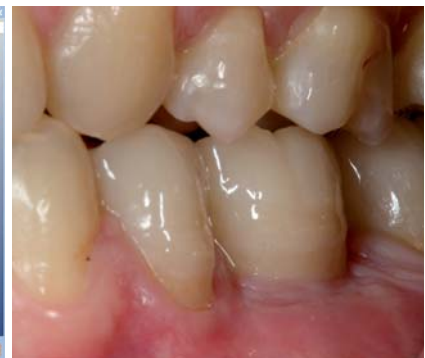
Abb. 9: CAD-Prozess für ein zweiteiliges Zirkonoxidabutment (Cercor Art, DeguDent GmbH, Hanau. – Abb. 10: Lateralansicht der zementierten vollkeramischen Kronen. Das Durchtrittsprofil der Implantatsuprastruktur ist identisch mit einem natürlichen Zahn.