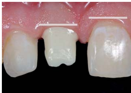
Abb. 3: Stabile Weichgewebssituation fünf Wochen nach der Eingliederung der laborgefertigten provisorischen Versorgung. – Abb. 4: Individuell gefertigtes Zirkonoxidabutment ohne ausreichende Berücksichtigung der benachbarten Weichgewebkontur. Der Präparationsrand liegt zwar nur leicht subgingival, die resultierende Kronenform wird aber nicht zum benachbarten Zahn passen.