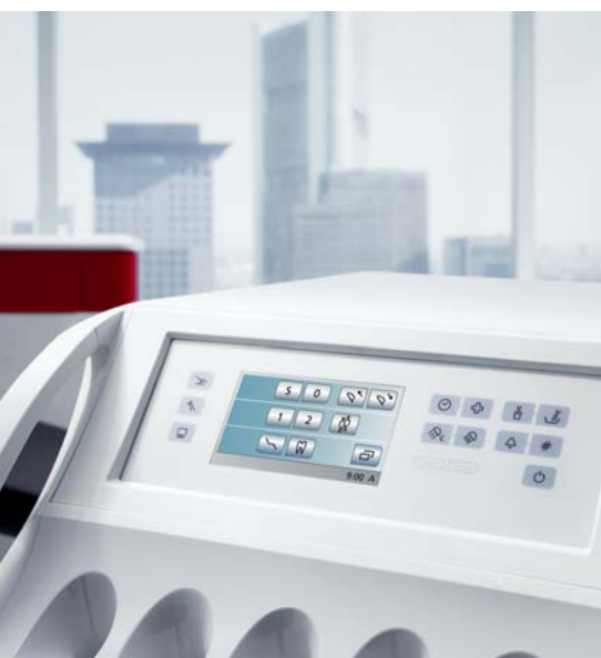
Abb. 2: SINIUS wird über die intuitiv verständliche Bedienoberfläche EasyTouch gesteuert.

Trotz seiner einfachen Bedienung ist SINIUS vielfältig einsetzbar. Neben den Standardbehandlungen wie Füllungs- und Parodontaltherapie nutzen wir sie auch für implantologische, chirurgische sowie parodontal-ästhetische Operationen. Sehr praktisch finde ich dabei die Endodontiefunktion und den ApexLocator – mit dem Wurzelkanalspitzen präzise und einfach lokalisiert werden können –, die optional in die Einheit integriert sind. Das hat den Vorteil, dass wir, wenn wir beispielsweise eine Wurzelbehandlung durchführen, keine zusätzlichen Geräte anschließen müssen. Außerdem reduziert dies die Zahl der Kabel im Behandlungsraum, über die man stolpern könnte.