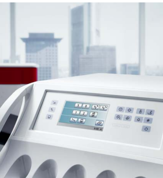
Abb. 2: SINIUS wird über die intuitiv verständliche Bedienoberfläche EasyTouch gesteuert.

Trotz seiner einfachen Bedienung ist SINIUS vielfältig einsetzbar. Neben den Standardbehandlungen wie Füllungs- und Parodontaltherapie nutzen wir sie auch für implantologische, chirurgische sowie parodontal-ästhetische Operationen. Sehr praktisch finde ich dabei die Endodontiefunktion und den ApexLocator – mit dem Wurzelkanalspitzen präzise und einfach lokalisiert werden können –, die optional in die Einheit integriert sind. Das hat den Vorteil, dass wir, wenn wir beispielsweise eine Wurzelbehandlung durchführen, keine zusätzlichen Geräte anschließen müssen. Außerdem reduziert dies die Zahl der Kabel im Behandlungsraum, über die man stolpern könnte.