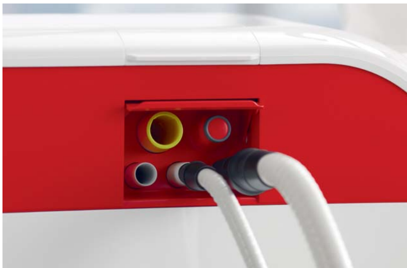
Abb. 3: Die integrierten Sanieradapter erleichtern die Reinigung der Saugschläuche deutlich.

Neben dem Zeitmanagement spielt bei unseren Patienten das Thema Hygiene in der Zahnarztpraxis eine extrem wichtige Rolle. Bei SINIUS kommen beide Punkte nicht zu kurz. An die integrierten Sanieradapter können Saugschläuche einfach angeschlossen und per Knopfdruck mit Wasser gereinigt werden. Optional kann auch eine chemische Reinigung erfolgen. Das spart meinem Team extrem viel Zeit. Auch die restliche Behandlungseinheit ist mit ihren glatten Oberflächen und den abnehmbaren Teilen an Arzt- und Assistenzelement leicht zu reinigen. Nicht nur das Hygienekonzept ist beim SINIUS stimmig: Dadurch, dass der Behandler die Oberfläche EasyTouch auch mit dem Fußpedal bedienen kann, wird die Hygienekette nicht unterbrochen.