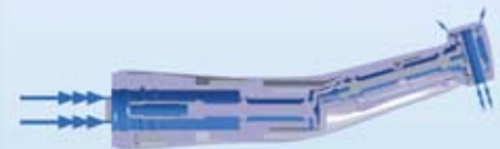
3. Pflege von Getriebe und Kugellager