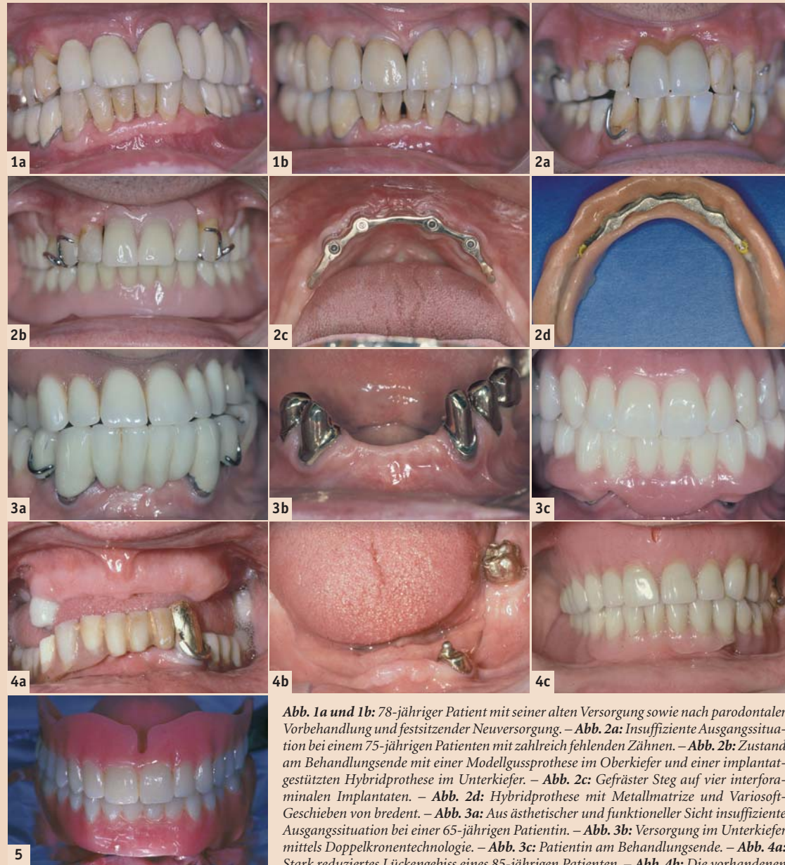
Abb. 5: Auch die konventionelle Totalprothetik ist nach wie vor beim älteren Menschen eine häufige Versorgungsart.

Zahnersatz neue Lebensqualität gegeben werden. Neben den zahnlosen Patienten, die konventionell nicht zufriedenstellend versorgt werden können, werden Implantate auch vermehrt an strategisch wichtigen Positionen platziert, um die Prognose des Zahnersatzes zu verbessern (Spiekermann 1994). Außerdem wünschen sich viele Patienten eine implantatgestützte Brückenversorgung statt herausnehmbaren Teilprothesen.