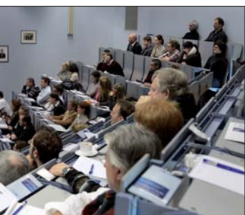
Ein interdisziplinäres Update stand im Mittelpunkt der diesjährigen Veranstaltung, die wie immer auf großes Interesse stieß.

plinärität. Als Referenten konnten dazu erfahrene Behandler aus vielen Bereichen der Zahnheilkunde gewonnen werden. So wurden neben kieferorthopädischen auch zahnärztlich-konservierende, parodontologische, radiologische und mund-kiefergesichts-chirurgische Themen beleuchtet.