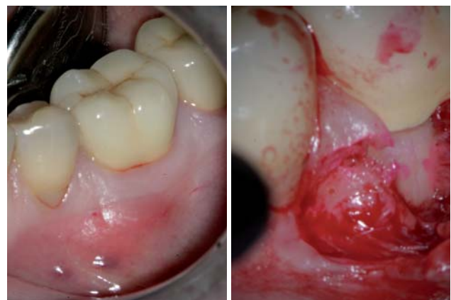
Abb. 1: Klinische Situation Zahn 36. – Abb. 2: Diagnostik der vertikalen Frakturlinie nach Lappenbildung, Anfärben und Betrachtung unter dem Dentalmikroskop.

Die mit Abstand wichtigste Entwicklung der letzten Jahre in der Endodontie wird von der Einführung von Nickel-Titan-Instrumenten (NiTi-Instrumente) und der rotierenden Aufbereitungstechnik dargestellt. Die hochflexiblen Instrumente, in einer rotierenden Arbeitsweise angewendet, erlauben es dem Behandler, ermüdungsfrei und mit vorhersehbarer Erfolgsquote zu arbeiten. Das Design der Instrumente, gepaart in der Regel mit der Crown-down-Aufbereitungstechnik, führt zu einer Abnahme der postoperativen Schmerzen. Die Anwendung der maschinellen Aufbereitung hat in der täglichen Sprechstunde die Grenzen der endodontischen Therapie erweitert. Fälle, die bis dato als nicht beherrschbar galten, können mithilfe der modernen Verfahren sicher und mit Erfolg behandelt werden. Durch Anwendung der Hybridtechnik kann unter Einbeziehung verschiedener Instrumentensysteme bis hin zu den Handinstrumenten eine Vielzahl der Problemfälle behandelt werden. Die Aufbereitung der Wurzelkanäle bis zum apikalen Terminus wird dadurch erleichtert.