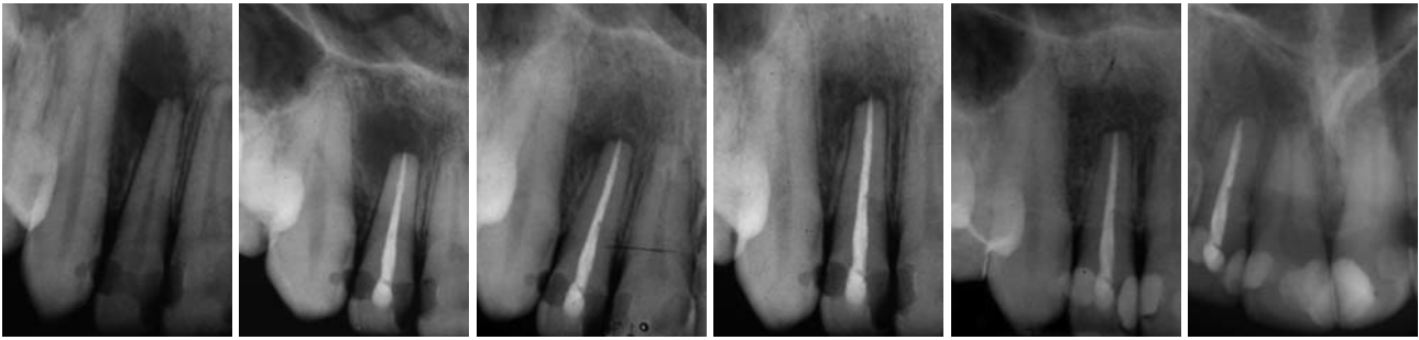
Abb. 7: Präoperativer röntgenologischer Befund Zahn 12 aus dem Jahre 1999 – massive apikale Aufhellung. – Abb. 8: Kontrollaufnahme 1999 – die Wurzelkanalfüllung erfolgte mithilfe thermoplastifizierter Guttapercha in vertikaler Kondensationstechnik. – Abb. 9: Kontrollaufnahme 2000 – die apikale Läsion zeigt eine deutliche Verkleinerung – die Heilungsdynamik der Läsion ist erkennbar, auch wenn apikal ein leicht verbreiteter PA-Spalt erkennbar ist. – Abb. 10: Kontrollaufnahme 2003 – die apikale Läsion ist komplett verschwunden, der PA-Spalt erscheint apikal noch leicht erweitert. – Abb. 11: Kontrolle 2006 – klinisch unauffälliger Zahn 12, röntgenologisch leicht verbreiteter apikaler PA-Spalt. – Abb. 12: Kontrollaufnahme 2010 – elf Jahre post OP – stabile apikale Verhältnisse apikal normal erscheinende Strukturen, PA-Spalt unauffällig, apikale Läsion komplett ausgeheilt.

Messgenauigkeit der elektrometrischen Längenmessgeräte der neuen Generationen, unabhängig von Störfaktoren wie Kanalinhalt, Kanal Anatomie, Wurzelkanalspülung oder Feilengröße. 3 Es konnte gezeigt werden, dass die Genauigkeit der elektrometrischen Messung zwischen 94,0 % und 100 % in 1 mm und 1,5 mm Distanz von dem anatomischen Apex variiert. 4