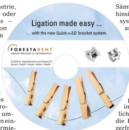
Wer sich rund um das Quick® 2.0-Bracket informieren möchte, kann bei FORESTADENT ab sofort kostenlos die 3. Version der Anwender-CD dieses selbstligierenden Systems erhalten.

Ob verbesserte Geometrie, optimierte Technik oder neue Molarenbrackets – die zweite Generation der Quick-Brackets von FORESTADENT hat viel zu bieten. Nicht umsonst erfreut sich dieses kleinste selbstligierende Einstück-Bracket der Welt einer großen Beliebtheit. Wer von den zahlreichen Vorteilen des Quick® 2.0-Systems profitieren und sich noch umfangreicher über dessen einfaches Handling informieren möchte, kann ab sofort die überarbeitete Anwender-CD erhalten. Diese nunmehr 3. Version liegt bei Bestellung des Quick® 2.0-Starter-Kits diesem automatisch bei bzw. kann separat