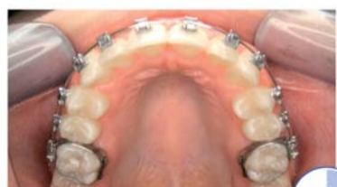
Patient courtesy Dr. Ludwig and Dr. Glas, Traben-Trarbach Germany with BioStarter 0.012" initially

FORESTADENT Bernhard Förster GmbH Westliche Karl-Friedrich-Straße 151 75172 Pforzheim Tel.: 0 72 31/4 59-0 Fax: 0 72 31/4 59-1 02 E-Mail: info@forestadent.com www.forestadent.com