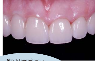
Abb. 1: Langzeitprovisorische Versorgung der Oberkiefer-Frontzähne zur Evaluierung ästhetischer und funktioneller Aspekte. Deutlich fällt der ungleichmäßige Verlauf der marginalen Gingiva im Bereich des Zahnes 21 ins Auge.