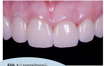
Abb. 1: Langzeitprovisorische Versorgung der Oberkiefer-Frontzähne zur Evaluierung ästhetischer und funktioneller Aspekte. Deutlich fällt der ungleichmäßige Verlauf der marginalen Gingiva im Bereich des Zahnes 21 ins Auge.