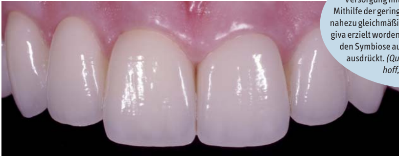
Abb. 3: Postoperative Situation nach definitiver Versorgung mit glaskeramischen Kronen. Mithilfe der geringen Knochenkorrektur ist eine nahezu gleichmäßige Kontur der marginalen Gingiva erzielt worden, die sich in einer ansprechenden Symbiose aus roter und weißer Ästhetik ausdrückt.

probiert werden, damit der Zahnarzt unter Sicht zuerst einmal ein Gefühl für die Abtragsleistung bekommt.