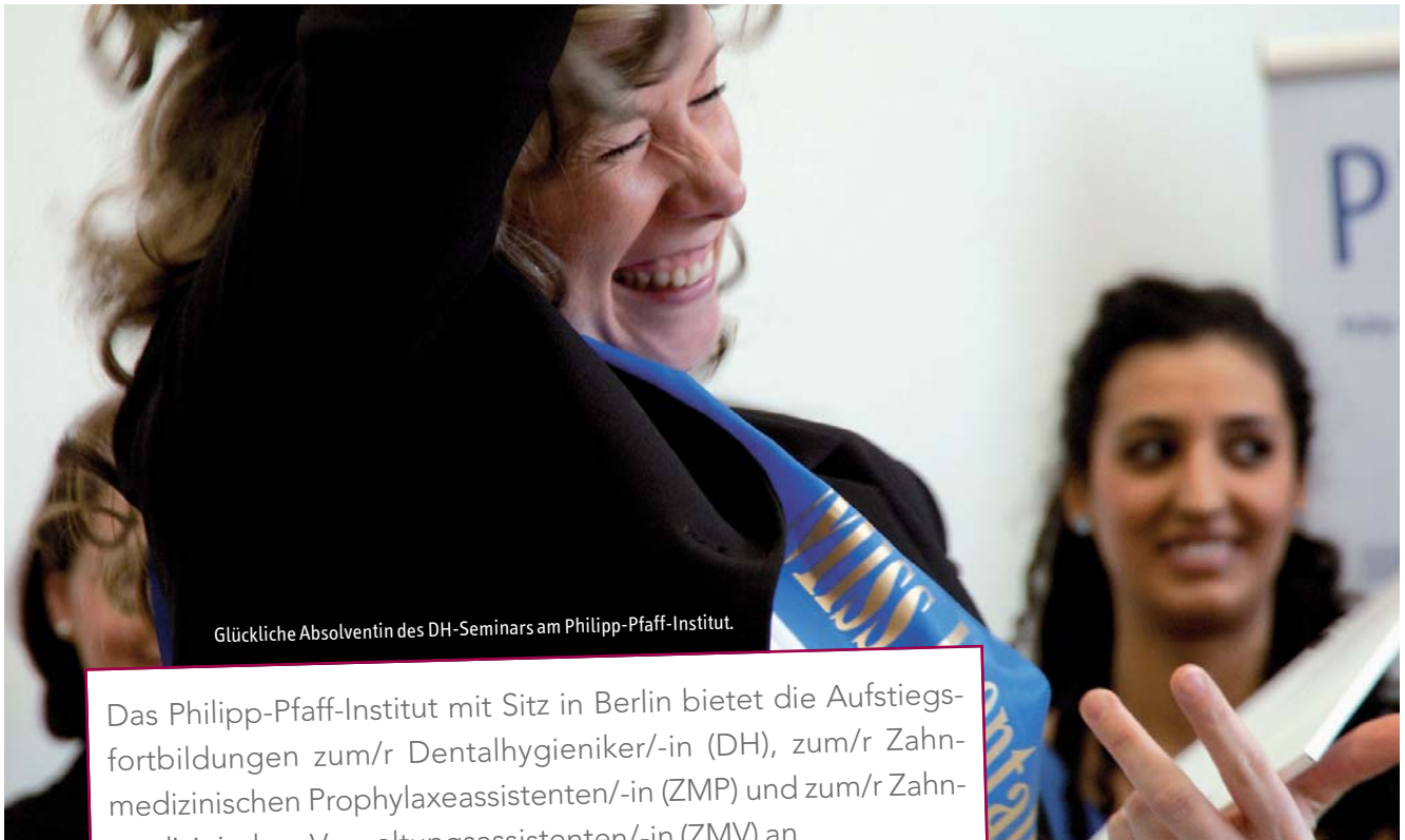
Glückliche Absolventin des DH-Seminars am Philipp-Pfaff-Institut.

Das Philipp-Pfaff-Institut mit Sitz in Berlin bietet die Aufstiegsfortbildungen zum/r Dentalhygieniker/-in (DH), zum/r Zahnmedizinischen Prophylaxeassistenten/-in (ZMP) und zum/r Zahnmedizinischen Verwaltungsassistenten/-in (ZMV) an.