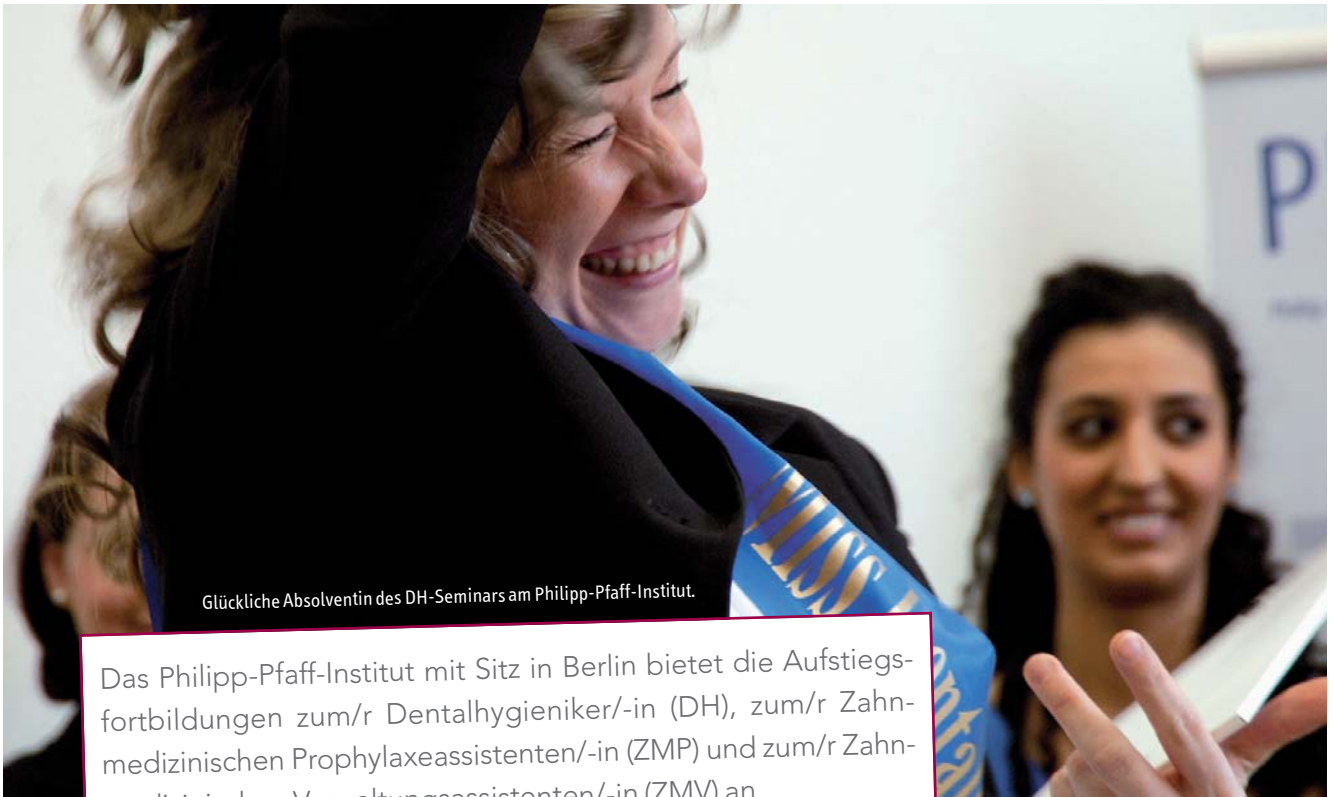
Glückliche Absolventin des DH-Seminars am Philipp-Pfaff-Institut.

Das Philipp-Pfaff-Institut mit Sitz in Berlin bietet die Aufstiegsfortbildungen zum/r Dentalhygieniker/-in (DH), zum/r Zahnmedizinischen Prophylaxeassistenten/-in (ZMP) und zum/r Zahnmedizinischen Verwaltungsassistenten/-in (ZMV) an.