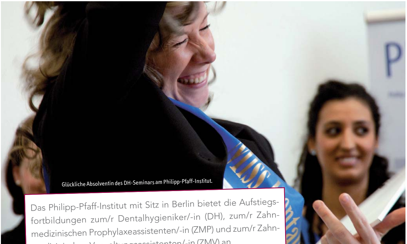
Glückliche Absolventin des DH-Seminars am Philipp-Pfaff-Institut.

Das Philipp-Pfaff-Institut mit Sitz in Berlin bietet die Aufstiegsfortbildungen zum/r Dentalhygieniker/-in (DH), zum/r Zahnmedizinischen Prophylaxeassistenten/-in (ZMP) und zum/r Zahnmedizinischen Verwaltungsassistenten/-in (ZMV) an.