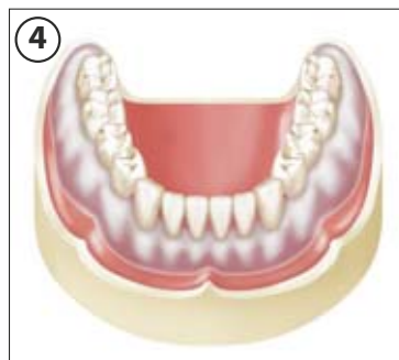
4 Prothese sicher positioniert und fixiert