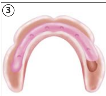
3 Unterfütterung mit Tuf-Link