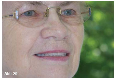
Abb. 9: Die Mundsituation mit in den Implantaten integrierten Gingivaformen. – Abb. 10: Der Implantat-Check im Mund. – Abb. 11: Ausgangssituation nach Extraktion des letzten Pfeilerzahns. – Abb. 12: Die gleiche Situation mit transparentem Kunststoff. – Abb. 13: Die ISUS by Compartis-Hybridbrücke im Anlieferungszustand. – Abb. 14: Zur Durchführung des Sheffield-Tests wurde die Brückenstruktur mit den Laboranalogen gefügt (orale Ansicht). – Abb. 15: Gut zu erkennen: der Formschluss durch die konischen Interfaces (vestibuläre Ansicht). – Abb. 16: Passungsprüfung der Implantatsuprastruktur im Mund. – Abb. 17: Die Suprastruktur auf dem Modell. – Abb. 18: Die inkorporierten Prothesen: Die bedingt herausnehmbare Unterkieferprothese ist durch die Führungskanäle für die Interdentalbürste gut zu reinigen. – Abb. 19: Ober- und Unterkieferprothesen in ursprünglicher Bisslage. – Abb. 20: Die zufriedene Patientin

Prothese so optimal wie möglich zu gestalten. Mit einem Komposit für die Individualisierung (Gradia Gum, GC, Bad Homburg) gestalteten wir die Umgebung des marginalen Zahnfleisches in einem hellen, nach basal mit einem kräftigeren Rot. Durch die Lichtbrechung im Kunststoff erhielt die Prothese ein natürliches Aussehen (Abb. 19).