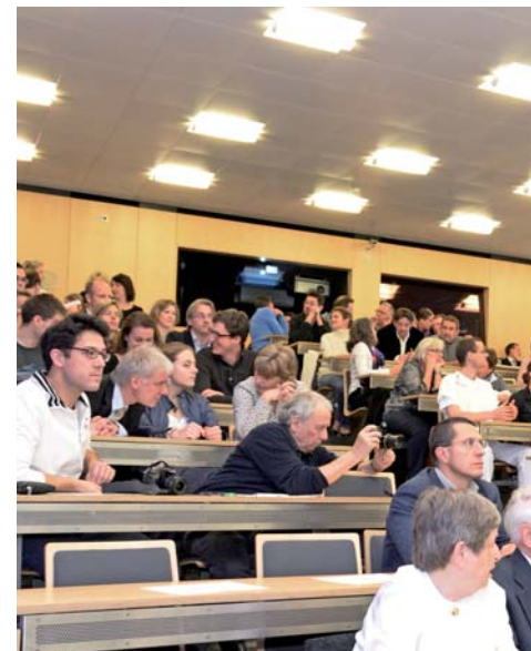
Nationale und internationale Gäste wohnten der Antrittsvorlesung bei.