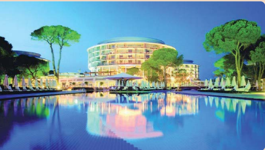
Im Hotel Calista Luxury Resort im türkischen Belek veranstaltet BEGO Implant Systems vom 27. bis 28. April 2012 seinen zweiten Mittelmeerkongress. Thema: „3D – Discover Digital Dentistry“.

BREMEN – Der deutsche Implantat-spezialist BEGO Implant Systems ver-anstaltet am 27. und 28. April 2012 seinen zweiten Mittelmeerkongress im türkischen Belek/Antalya. Die Teil-nehmer haben die Gelegenheit, sich