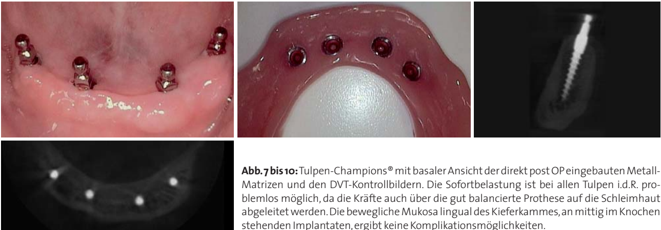
Abb. 7 bis 10: Tulpen-Champions® mit basaler Ansicht der direkt post OP eingebauten Metall-Matrizen und den DVT-Kontrollbildern. Die Sofortbelastung ist bei allen Tulpen i.d.R. problemlos möglich, da die Kräfte auch über die gut balancierte Prothese auf die Schleimhaut abgeleitet werden. Die bewegliche Mukosa lingual des Kieferkammes, an mittig im Knochen stehenden Implantaten, ergibt keine Komplikationsmöglichkeiten.

rationen letztendlich nur ca. 1.200 als Implantatgetragene ZEs durchgeführt werden. Gerade in den nicht nur chirurgisch orientierten Praxen fehlt häufig auch die notwendige Motivation, allen Patienten die oftmals bessere implantatgetragene Variante vorstellen zu wollen. Zu viele Patientenabsagen aufgrund der hohen Gesamtkosten tun dann ihr Übriges.