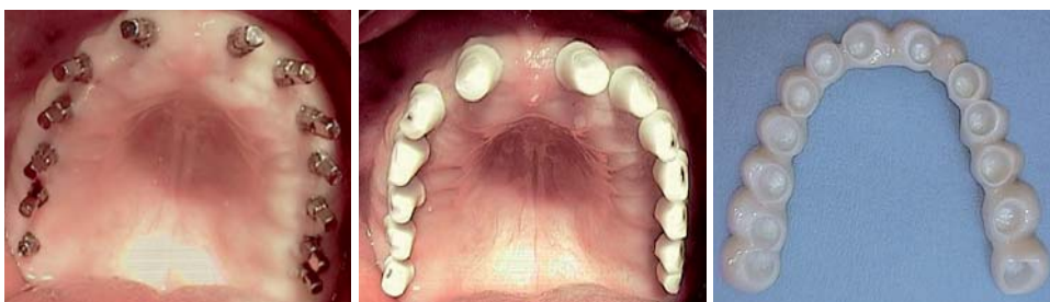
Abb. 4 bis 6: Einteilige Champions® und präparierte Zirkon-„Prep-Caps“ direkt post OP und die basale Ansicht der gefrästen Zirkonbrücke, die innerhalb von zehn Tagen spannungsfrei mit Implantalink semi einzementiert wurde.