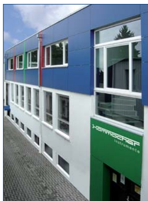
▲ Aus kleinsten Anfängen zur anerkannten Marke – 90 Jahre Hammacher, ein Traditionsunternehmen feiert Geburtstag.

Qualität setzt sich durch! Die Karl Hammacher GmbH feiert ihr 90-jähriges Jubiläum. Was einst am 22. Januar 1922 in kleinsten Anfängen begann, wurde zur Er-