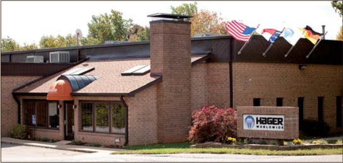
Der neue Hauptsitz von Hager Worldwide in Hickory, North Carolina.

Eine Erfolgsgeschichte, die Tradition und Innovation verbindet.