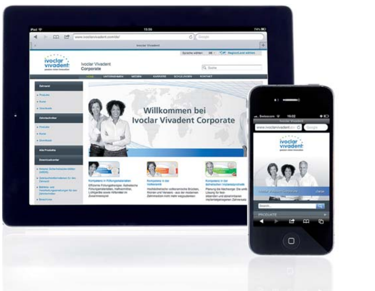
Die Webseite von Ivoclar Vivadent wurde für Smartphones und Tablet-PCs optimiert.

Ivoclar Vivadent optimiert Internetauftritt für Nutzer von Smartphones und Tablet-PCs.