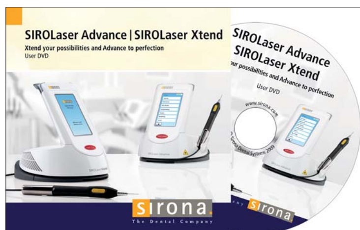
Die Anwender-DVD des SIROLaser Advance und SIROLaser Xtend ist gerade für Einsteiger eine erste wichtige Orientierung.

Sirona hat in mehreren Sprachen Kurzfilme produziert, die praxisnah Anwendungen des SIROLaser Advance sowie des SIROLaser Xtend veranschaulichen.