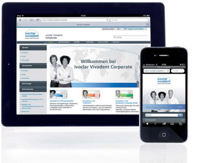
Die Webseite von Ivoclar Vivadent wurde für Smartphones und Tablet-PCs optimiert.

Ivoclar Vivadent optimiert Internetauftritt für Nutzer von Smartphones und Tablet-PCs.