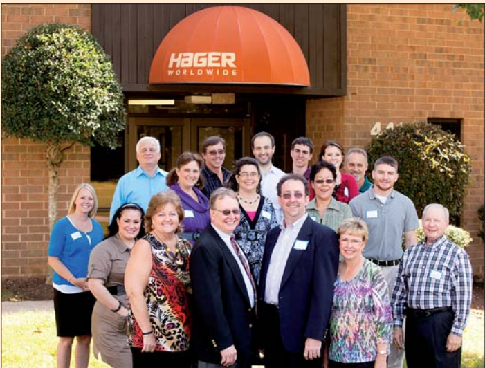
Das Hager Worldwide-Vertriebsteam.