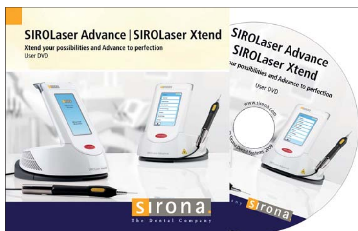
Die Anwender-DVD des SIROLaser Advance und SIROLaser Xtend ist gerade für Einsteiger eine erste wichtige Orientierung.

Sirona hat in mehreren Sprachen Kurzfilme produziert, die praxisnah Anwendungen des SIROLaser Advance sowie des SIROLaser Xtend veranschaulichen.