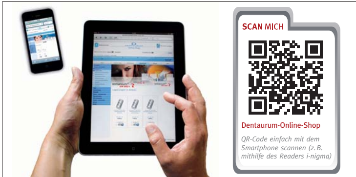
Produkt finden und direkt bestellen mit dem mobilen Online-Shopping.

Online Bestellen hat viele Vorteile: Es ist einfach, schnell, bequem und rund um die Uhr möglich. Vor allem die Beratung, die beim Kauf von Dentalprodukten besonders wichtig ist, kommt im neuen Online-Shop der Dentaurum-Gruppe nicht zu kurz. Bei einer Online-Bestellung ist es hilfreich, wenn alle Informationen zum Produkt einfach zu finden sind.