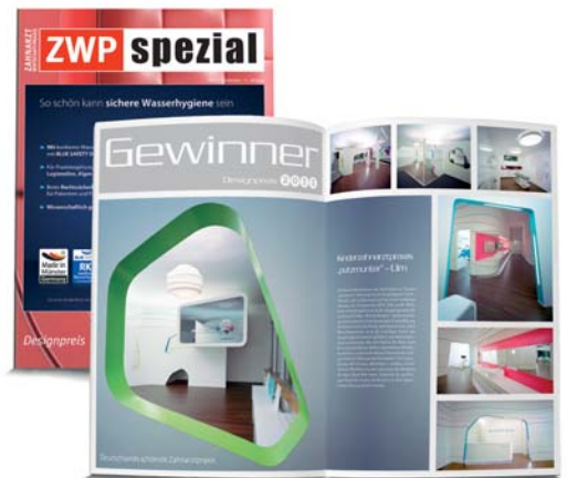
Bilderstrecke zum ZWP Designpreis-Gewinner 2011 in der ZWP spezial 9/2011.

weiligen Behandlungszimmer zu finden. Verlaufen können sich die Kinder in der weiträumigen Zahnarztpraxis also nicht. Und ebenso wenig kommen sie an der richtigen Zahnpflege vorbei – erster Zwischenstopp der Weltreise sind die in unterschiedlichen Höhen angeordneten Kinderwaschbecken zum Erlernen der richtigen Zahnpflege. „Mundhygiene ist immerhin der Kern der Praxis“, erklärt Katrin Lehmann.