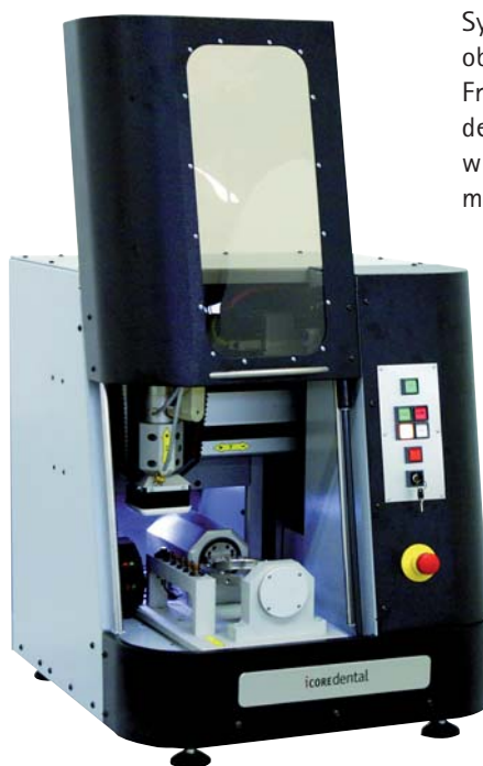
Fräsmaschine 340i: Leistungsfähiges und bewährtes Einstiegsgerät für die dentale Automatisierung.

„Auch die Dentalindustrie ist gefordert neue Wege zu gehen“, so die Meinung von Dr. Jo-