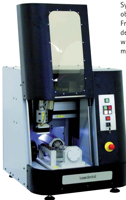
Fräsmaschine 340i: Leistungsfähiges und bewährtes Einstiegsgerät für die dentale Automatisierung.