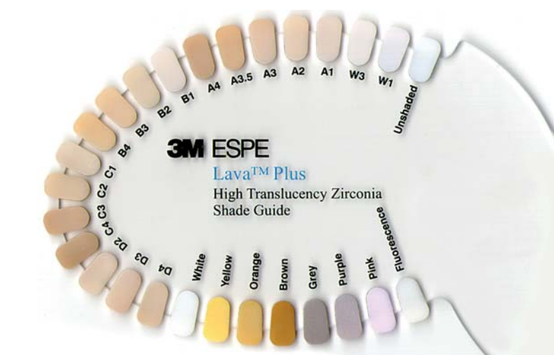
Abb. 5: Verfügbare Lösungen zum Einfärben und Charakterisieren von Lava™ Plus Zirkonoxid.

konoxid ist den Nachbarzähnen optisch sehr ähnlich. Auch aus materialtechnischer Sicht erscheint es sinnvoll, eine Metalllegierung mit unterschiedlichsten Inhaltsstoffen und der Gefahr von elektrischen Strömen im Mund gegen eine biokompatible Krone aus Zirkoniumdioxid auszutauschen.