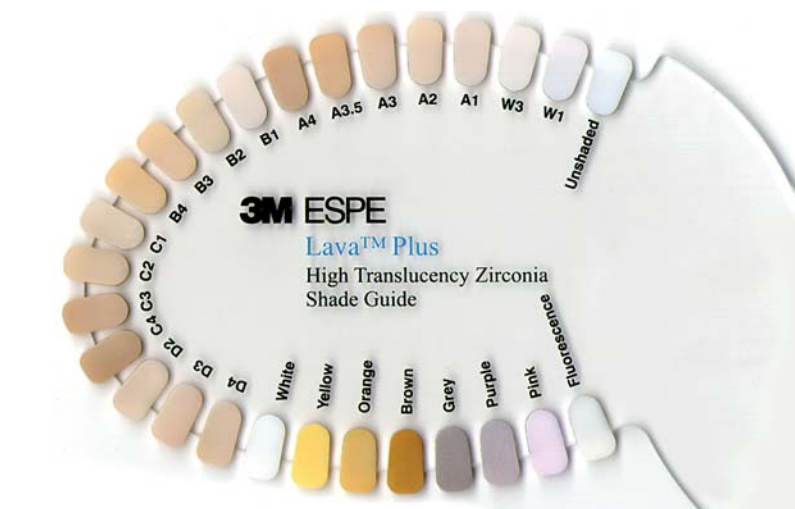
Abb. 5: Verfügbare Lösungen zum Einfärben und Charakterisieren von Lava™ Plus Zirkonoxid.

konoxid ist den Nachbarzähnen optisch sehr ähnlich. Auch aus materialtechnischer Sicht erscheint es sinnvoll, eine Metalllegierung mit unterschiedlichsten Inhaltsstoffen und der Gefahr von elektrischen Strömen im Mund gegen eine biokompatible Krone aus Zirkoniumdioxid auszutauschen.