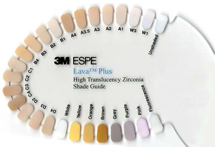
Abb. 5: Verfügbare Lösungen zum Einfärben und Charakterisieren von Lava™ Plus Zirkonoxid.

konoxid ist den Nachbarzähnen optisch sehr ähnlich. Auch aus materialtechnischer Sicht erscheint es sinnvoll, eine Metalllegierung mit unterschiedlichsten Inhaltsstoffen und der Gefahr von elektrischen Strömen im Mund gegen eine biokompatible Krone aus Zirkoniumdioxid auszutauschen.