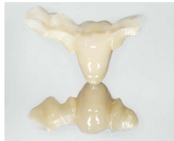
Abb. 6: Inlay-Brücke mit Gerüst aus Lava™ Plus Zirkonoxid.

Abrasion am Antagonisten kommt als bei NEM- bzw. Feldspatkeramik-Kauflächen (Abb. 4). Eine wichtige Voraussetzung dafür ist allerdings, dass die Kronen aus Zirkoniumdioxid manuell poliert werden und dies auch nach möglichen Anpassungen im Mund geschieht. Wird dies unterlassen und es erfolgt lediglich ein Glasurbrand, bei dem die Glasurmasse nicht in die Keramikoberfläche diffundieren kann, entsteht eine sägeartige raue Struktur, welche sofort den Antagonisten schädigt.