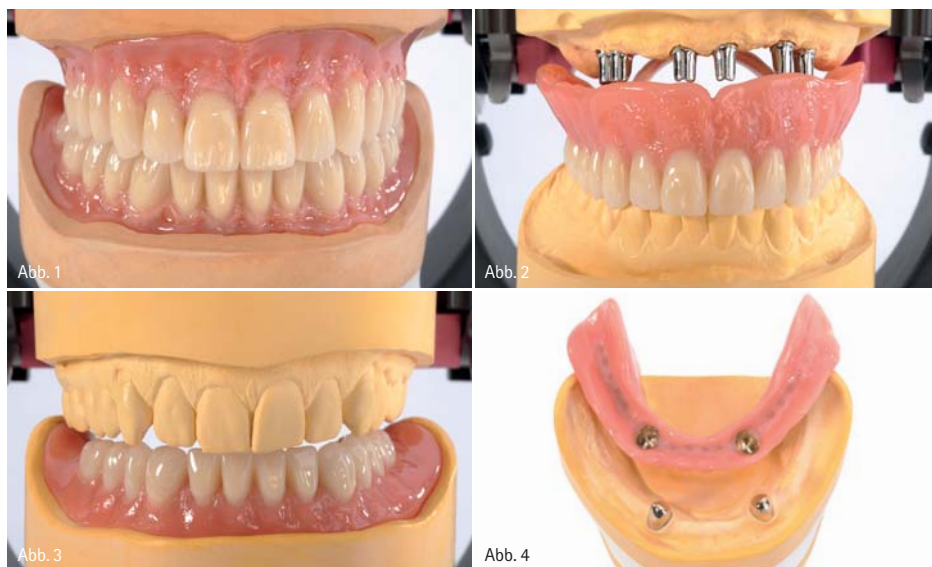
Abb. 1 und 2: Von der Totalprothese bis zur Oberkiefer-Implantatarbeit: Mit zeitgemäßen Konfektionszähnen wird der Zahntechniker allen Ansprüchen und Indikationen für zuverlässige und einfach aufzustellende Prothesen gerecht. – Abb. 3 und 4: Diese Teleskoparbeit bei geringem vertikalen Platzangebot wurde mit PALA Premium L19 in der Front harmonisch gelöst.

Bei 14 Round Table-Veranstaltungen informieren Experten von Heraeus in ganz Deutschland über die Vorteile zeitgemäßer Zahnlinien. Externe Referenten erläutern am eigenen Patientenfall, wie sie damit selbst in der implantatgetragenen Hybridprothetik alle ästhetischen und funktionellen Wünsche erfüllen.