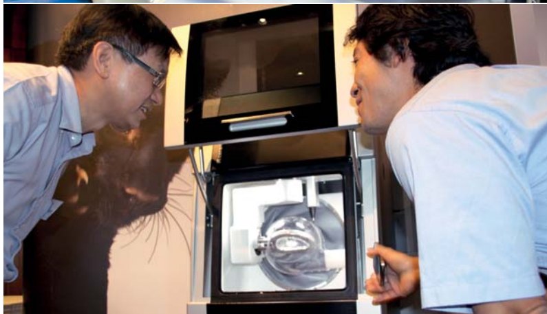
Oben: „Where pioneers meet!“ Europäischen Handelspartnern von Amann Girrbach präsentierte sich die Ceramill Motion 2 zum ersten Mal im Dornier Museum in Friedrichshafen am Bodensee. – Singapur: Die Ceramill Motion 2 vereint 5-Achs-Frästechnik (nass/trocken) mit der Nass-Schleiftechnik in einem kompakten Gerät – da lohnt es sich genauer hinzuschauen.

W ir freuen uns, unseren Kunden eine weitere Entwicklung der Produktlinie Ceramill präsentieren zu können. Die Motion 2 ist für jedes Dentallabor eine