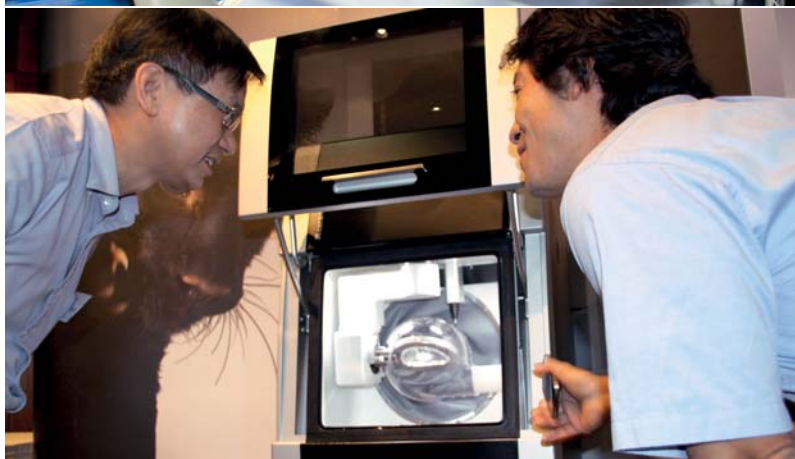
Oben: „Where pioneers meet!“ Europäischen Handelspartnern von Amann Girrbach präsentierte sich die Ceramill Motion 2 zum ersten Mal im Dornier Museum in Friedrichshafen am Bodensee. – Singapur: Die Ceramill Motion 2 vereint 5-Achs-Frästechnik (nass/trocken) mit der Nass-Schleiftechnik in einem kompakten Gerät – da lohnt es sich genauer hinzuschauen.

W ir freuen uns, unseren Kunden eine weitere Entwicklung der Produktlinie Ceramill präsentieren zu können. Die Motion 2 ist für jedes Dentallabor eine