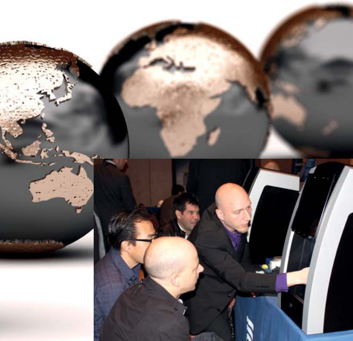
Auch im amerikanischen Chicago konnte die neue 5-Achs-Anlage zeigen, was sie kann.