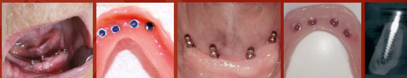
vier Tulpenkopf-Implantate im MIMI®-Verfahren...

a) zur Fixierung einer unteren Totalprothese bei einer 100-jährigen Risiko-Patientin