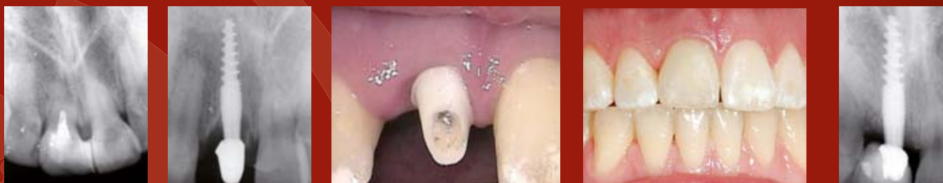
Sofortimplantation regio 11 – Extraktion und Implantation in einer Sitzung mit einem einteiligen Vierkant-Champion® und einem Zirkon Prep-Cap