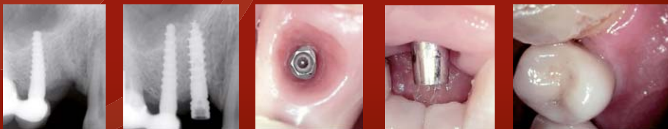
Einzelzahnimplantat eines zweiteiligen (R)Evolution® regio 14 – Jahre zuvor wurde bereits regio 15 ein einteiliges Champion® in Sofortbelastung zur Abstützung einer Brücke inseriert.