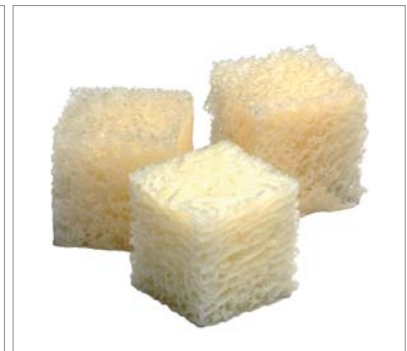
Argon OsteoGraft® Spongiosa Block 1ccm.

Die Meinungsvielfalt darüber, welche Materialien im Einzelnen als der „Goldstandard“ anzusehen sind, ist in der Regel ebenso breit, wie das Spektrum der angebotenen Materialien. Unterscheidet man die Knochenersatzmaterialien nach ihrer Herkunft, so lassen sich vier Arten von Knochenersatzmaterialien beschreiben: