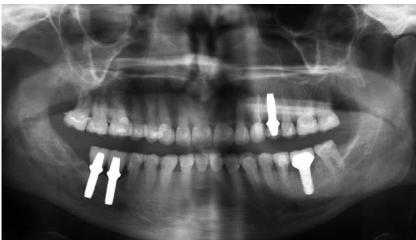
Abb. 15_ OPTG nach Einsetzen der Prothetik vor Entfernung der Zementüberschüsse.