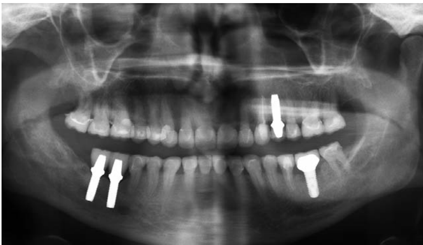
Abb. 15_ OPTG nach Einsetzen der Prothetik vor Entfernung der Zementüberschüsse.