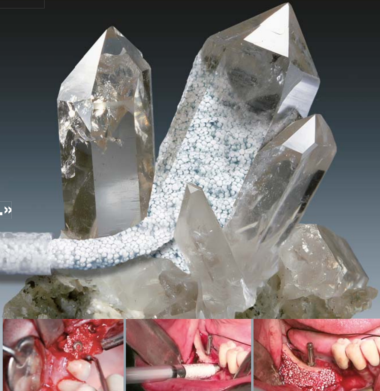
synthetic bone graft solutions - Swiss made