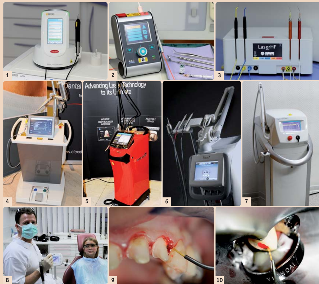
Abb. 1: SIROLaser Advance, ein kleiner, handlicher, komfortabler und für seine Sicherheit und Design ausgezeichneter Diodenlaser (Sirona Dental Systems GmbH). – Abb. 2: Diodenlaser Firma A.R.C. Laser GmbH Q 810, welcher auf den fotodynamischen Farbstoff EmunDo für die antibakterielle Photodynamische Therapie (aPDT) abgestimmt ist und erstmals 2011 auf der IDS in Köln vorgestellt wurde (Q810/FOX). – Abb. 3: Laser HF (Hager & Werken GmbH & Co. KG): das einzige Kombinationsgerät weltweit mit zwei Lasereinheiten 975 nm/6 W und 660 nm/25–100 mW sowie HF-Chirurgiekomponente 2,2 mHz für einfaches, schnelles und präzises Schneiden von Weichgewebe. – Abb. 4: elexxion delos 3.0, Kombination aus Er:YAG-Laser und 810 nm Diodenlaser mit bis zu 50 Watt Leistung und einer variablen Pulsierung bis zu 20.000 Hz (elexxion AG). – Abb. 5: Waterlase iPlus mit dualer Wellenlänge 2.780 nm und 940 nm – iLase (Firma Biolase Europe GmbH). – Abb. 6: Lightwalker von Fotona, Kombination aus Er:YAG- und Nd:YAG-Laser mit, laut Herstellerangaben, extrem hoher Schneidleistung im Hart- und Weichgewebe. – Abb. 7: KaVo KEY 3+ Laser, Er:YAG-Laser, Fa. KaVo Deutschland. – Abb. 8: LiteTouch™ (Syneron Dental Lasers) mit der bisher einzigartigen Laser-im-Handstück-Technologie (Er:YAG-Laser), klein und handlich. – Abb. 9: Stufenfreilegung und Hämostase bei Pfeilerpräparation mit Diodenlaser. – Abb. 10: Wurzelkanaldekontaminierung mit Nd:YAG-Laser.

So ist auch das Arbeiten im Molarenbereich unter klinischen Bedingungen gut möglich und eine geschlossene Kürettage im Seitenzahnbereich für den Behandler leichter durchzuführen (Liebaug und Wu 2011). Das ausgeklügelte