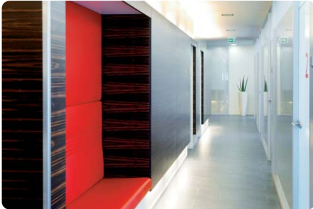
Abb. 5: Ein ideal genutzter Flurbereich.

in Abbildung 3 die Gestaltung des Rezeptionsbereichs mit dem angrenzenden Backoffice, wobei ein Raumteilerschrank die Wand ersetzt. Die Mitarbeiter, die für den Patienten da sind, sind direkt ansprechbar. Die Mitarbeiter, die administrative Aufgaben erledigen, haben einen beruhigten Bereich, der aber durch die Nähe zur Rezeption eine direkte interne Kommunikation gewährleistet.