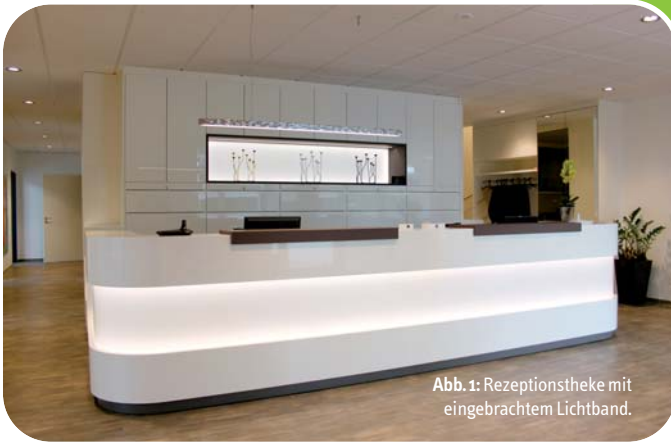
Abb. 1: Rezeptionstheke mit eingebrachtem Lichtband.

Auch für eine Praxis ist das Leitmotiv „Der Kunde steht im Mittelpunkt“ von großer Bedeutung: Der Patient wird immer mehr als Kunde gesehen, die Praxisatmosphäre soll einladen und nicht an eine Klinik erinnern. Der Grundgedanke dabei: Es geht um Gesundheit, nicht um Krankheit! Der Patient soll sich also in einer angstfreien und einladenden Atmosphäre wohlfühlen.