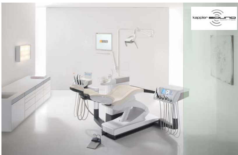
Abb. 1: Behandlungszeile CRETA. Das integrierte Soundsystem ist vom Behandlungsstuhl aus steuerbar.

den Patienten, Ihren Mitarbeitern und Ihnen. Das Kappler Med+Org Möbelprogramm ist eines der umfassendsten am Markt und betont den Systemgedanken. Es kann sehr flexibel eingesetzt und bei Bedarf jederzeit durch passende individuelle Lösungen ergänzt werden. Von der Theke über Behandlungsmöbel bis hin zum Sterilisationsmöbel und Wartezimmer liefern die Spezialisten für Arztpraxen alles aus einer Hand. Die Produkte sind ausgereift und haben ihre Alltagstauglichkeit in harten Langzeittests, teilweise bis zu einem Jahr, unter Beweis gestellt. Kappler Med+Org GmbH sind zusammen einhundert Jahre alt. Für die schwäbischen Tüftler kein Grund zurückzublicken. Ein Beispiel für innovative Praxiseinrichtung: die Behandlungszeile CRETA (Abb. 1). Minimalistisch im Design und bodenfrei aufgehängt, schwebt sie beinahe schwerelos im Raum. Selbst öffnende Schubladen, zentrale Stromversorgung, zahlreiche integrierbare Funk-