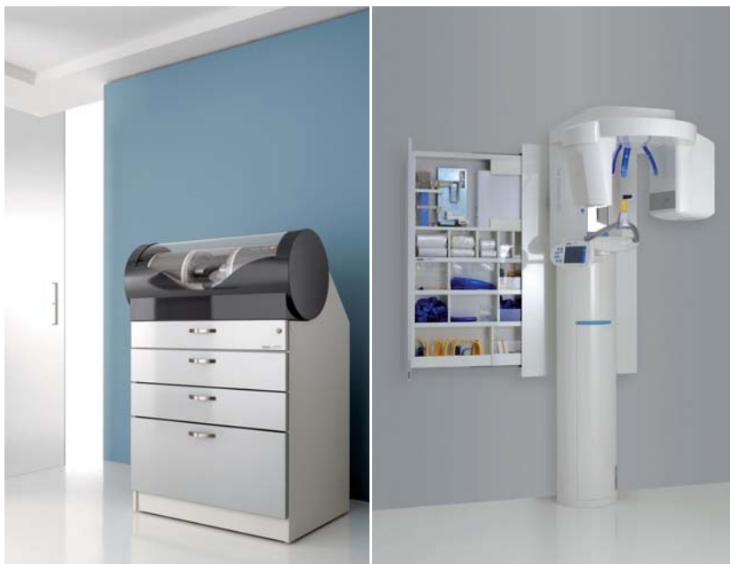
Abb. 2: Arbeitsschrank CEREC MC XL Station. – Abb. 3: Flacher Schubladenschrank X-ray cabinet.

Natürlich kann eine Praxiseinrichtung die fachliche Qualifikation eines Arztes nicht verbessern. Aber wer hervorragende Arbeit leistet, kann dies durch die richtige Einrichtung noch unterstreichen. Erstklassige Praxismöbel helfen Ihnen, sich nicht nur aus der Masse abzuheben, sondern auch ein Umfeld zu schaffen, von dem alle profitieren.