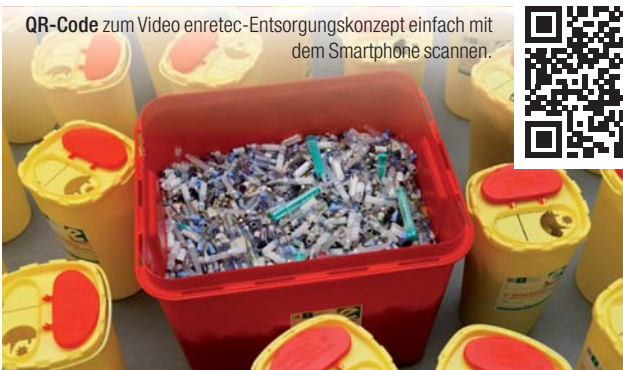
QR-Code zum Video enretec-Entsorgungskonzept einfach mit dem Smartphone scannen.

Für die schnelle und unkomplizierte Bestellung und Entsorgung kann sich die Praxis an ihren Dentalfachhändler oder an die enretec direkt wenden. Der Service erfolgt innerhalb von 24 Stunden und ist zudem eine kostengünstige Alternative zum klassischen Entsorgungsvertrag.