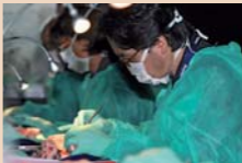
160 zum Teil internationale Teilnehmer übten z.B. Nahrtechniken in den Workshops auf dem Platina.

detete, das bisher bereits 900 Mitgliedern verzeichnet werden konnten.