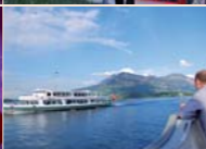
CAMLOG argierte mit dem Event auf der Regi den Gästen aus der ganzen Welt die Schweiz von der schönsten Seite: Schifffahrt auf dem Vierwaldstättersee, mit der Zahnerlebnisse auf die Regi, Alphabiermarkt mit Fahnenhochzügen, Trachtenstanz, Alpharäuber, traditionellen Spielen und abschliessendem Fest im grossen Saal.

Fremdenzunge erfolgreich am Markt einsetzen – finanziell unabhängig und schuldenfrei. Seit 2004 können ein kontinuierliches Umsatzwachstum verzeichnet werden.