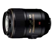
AFS VR Micro 105 mm