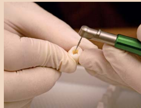
An mitgebrachten Zähnen konnte mit den Feilen gearbeitet werden.

Eine optimale Kombination stellen die Heroshape-Feilen mit dem Morita Zx-Antrieb dar. Mit der Feile „Endoflame“ lässt sich der Kanaleingang auf ein bis drei Millimeter erweitern. Ergänzend dazu gibt es noch Hero apikal für das apikale Drittel. Alle Feilen können auch mit der Hand verwendet werden. Mit einer Box, die eine Benutzungsanzeige enthält, hat der Behandler stets den Verbrauch im Blick. An mitgebrachten Zähnen konnten die Teilnehmer die Feilen gleich ausprobieren.