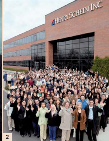
Abb. 2: Team Schein vom Headquarter in Melville, New York.