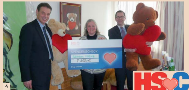
Abb. 4: Spendenübergabe des Henry Schein Cares-Projektes an die Bärenherz-Stiftung.

Henry Schein wurde einmal mehr in Fortunes Liste der „World's Most Admired Companies“ aufgenommen. Für 2012 erzielte das Unternehmen