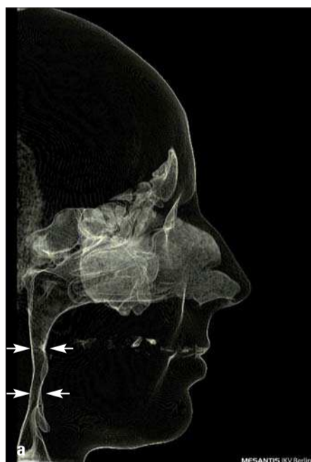
Abb. 3a, b: Darstellung einer Einengung des Oropharynx (Pfeile) in der Sagittalebene (a). Diese Veränderungen sind im Einzelfall nur durch Unterkiefervorverlagerungen – soweit kieferorthopädisch indiziert – zu therapieren. Der 2-D-Querschnitt der oberen Atemwege in der Sagittalebene täuscht in manchen Fällen aber nur ein geringes Volumen der oberen Atemwege vor. Daher sind 3-D-Aufnahmen, in denen man die Breite sowie das Volumen direkt berechnen kann, sehr vorteilhaft (b).