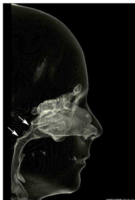
Abb. 2: Darstellung einer Hyperplasie der Tonsilla pharyngea (Pfeile) mithilfe der Spezialsoftware MESANTIS-3D. Derartige Befunde sind insbesondere bei Patienten mit Mundatmung von besonderer Bedeutung und in der interdisziplinären Behandlung mit HNO-Kollegen zu therapieren.