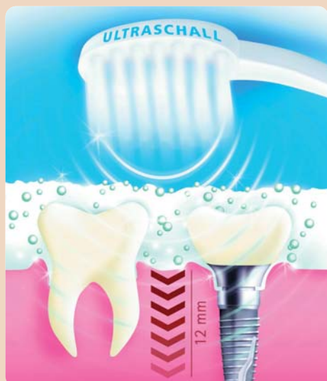
„Emmi-dental Professional“ plus Ultraschall-Zahncreme: das Dream Team für die Zahnreinigung und Mundhygiene.

Fluoridgehalt von 0,1 Prozent hat, Millionen Mikrobläschen, die Zahnstein, Verfärbungen durch Tee, Kaffee, Rotwein, Nikotin schonend entfernen. Wichtig ist, dass nur diese Spe-