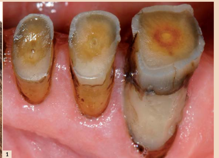
1 Abb. 1: Ausgeprägter Zahnhartsubstanzverlust bei einem 78-jährigen männlichen Patienten. Im vorliegenden Fall ist von einer primär abrasiv-atritiven Komponente auszugehen; anamnestisch fanden sich jedoch deutlich Hinweise auf einen erosiven Einfluss.

Mit dem täglichen Gebrauch der Zähne wird letzteren im Laufe des Lebens einiges zugemutet. Eine Vielzahl physikalischer, chemischer und biochemischer Noxen trägt in unterschiedlichem Ausmaß dazu bei, dass Zahnhartsubstanz verloren geht. Hierzu tragen in erster Linie Nahrungsmittel bei; kauzwingende Kost verursacht über Monate und Jahre einen erhöhten Abrieb, der bei Aufnahme von sauren Speisen und Getränken noch verstärkt wird. Auch Zahnpflegemittel können – bedingt durch Abrasivstoffe und den pH-Wert der verwendeten Substanzen – zu einem erhöhten Substanzverlust beitragen.