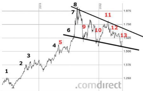
Goldchart vom 22.5.2010 bis 22.5.2012 mit Zuordnung zu den entsprechenden Headlines.

Bemerkenswert finde ich dabei, dass der weltbekannte Großspekulant George Soros bei einem Kurs von rund 1.500 Dollar pro Unze die Reißleine gezogen hat und dass bei Höchstkursen um 1.900 Dollar die Deutschen mal wieder mit „geschrumpftem Hirn“ im Rausch waren. Da hat nur noch gefehlt, dass Manfred Krug für den Kauf von Krügerrands erworben hat.