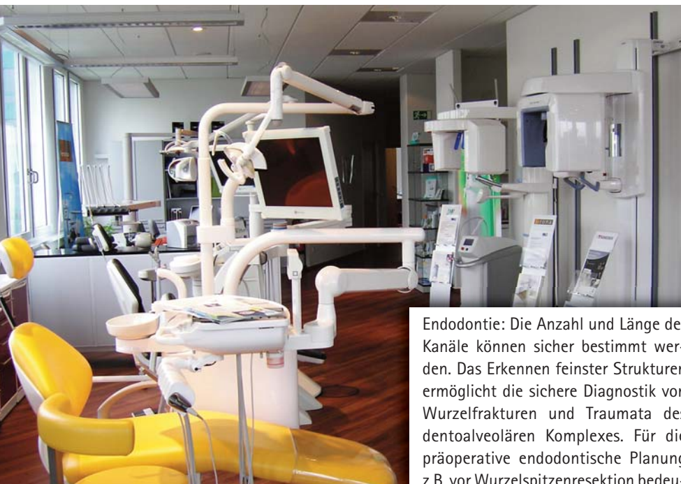
Beide Abbildungen: In den Ausstellungsräumen von dental bauer können sich die Kunden umfassend über die am Markt befindlichen Röntgengeräte informieren und fachkundig beraten lassen.

dental bauer im Bereich der digitalen bildgebenden Systeme. „Die Leasing- und Finanzierungsangebote von dental bauer erleichtern die Investitionsentscheidung“, ergänzt Laufer.