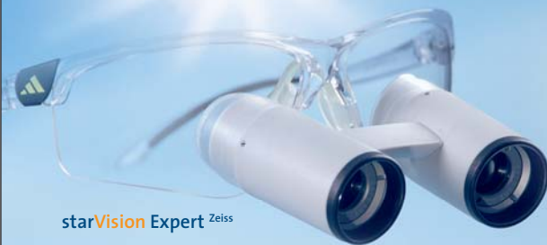
starVision Expert Zeiss

PRODUKTNEUHEIT (o. Abb.) starVision HD 3,5 TTL Galileisch