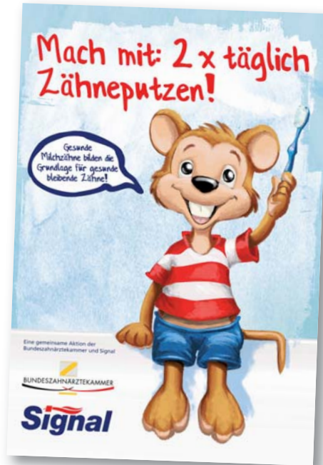
Der Ratgeber „Mach mit: 2 x täglich Zähneputzen!“ ist das Ergebnis einer Kooperation zwischen der FDI, der Bundeszahnärztekammer und Unilever.

Zähneputzen macht Spaß – das ist das Motto der neuen Zahnpflege-Broschüre „Mach mit: 2 x täglich Zähneputzen!“ In einem lustigen Comic erklärt Fritz, die Mutmach-Maus, wie man richtig Zähne putzt, um dem Kariesbakterium Freddy Schmuttel keine Chance zu geben. Der Zahnputzplan belohnt die Kinder täglich für die richtige Zahnpflege: Nach jedem Putzen darf ein Feld ausgemalt werden – morgens eine Sonne, mittags eine Blume und abends ein Stern. Die gut erklärten Ernährungstipps unterstützen zusätzlich die Kariesprävention. Fritz, die Mutmach-Maus, nimmt den Kindern durch die Motivation zur richtigen Zahnpflege auch die Angst vor regelmäßigen Zahnarztbesuchen.