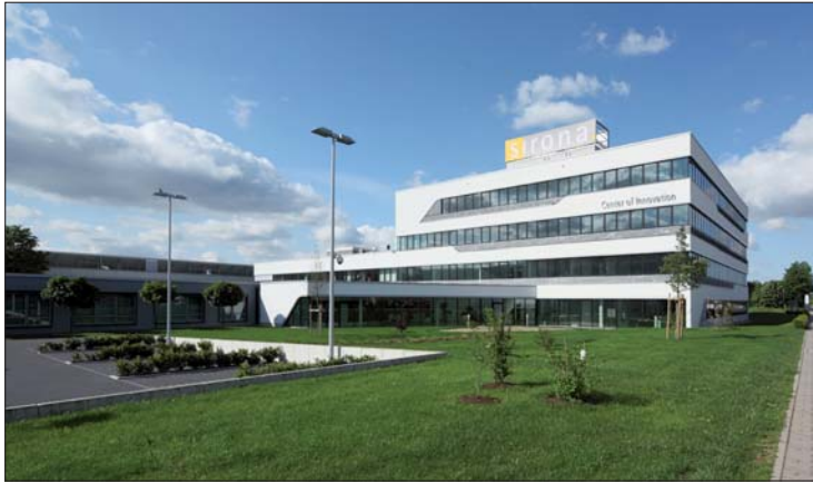
Das Sirona Innovationszentrum am Standort Bensheim 2012. Hier werden die Dentalinnovationen entwickelt.

Sirona blickt neben dem 50. Standortjubiläum in Bensheim auf eine 135 Jahre alte Firmengeschichte sowie auf 15 Jahre seit Gründung der Sirona Dental Systems GmbH zurück.