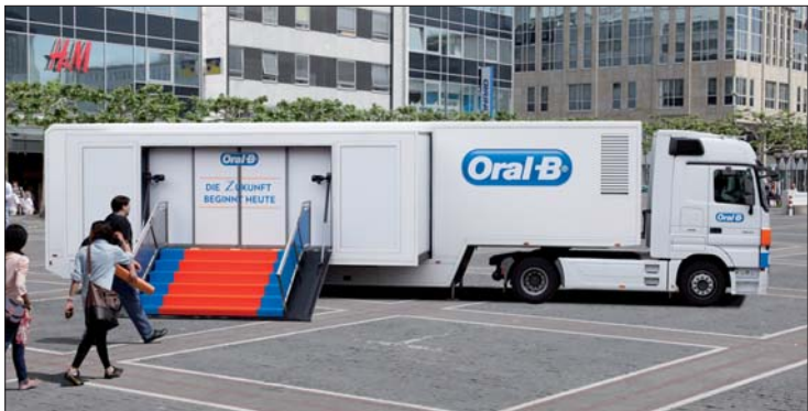
Oral-B TriZone Tour – der Oral-B Truck macht in zahlreichen Städten Deutschlands, Österreichs und in der Schweiz Station.