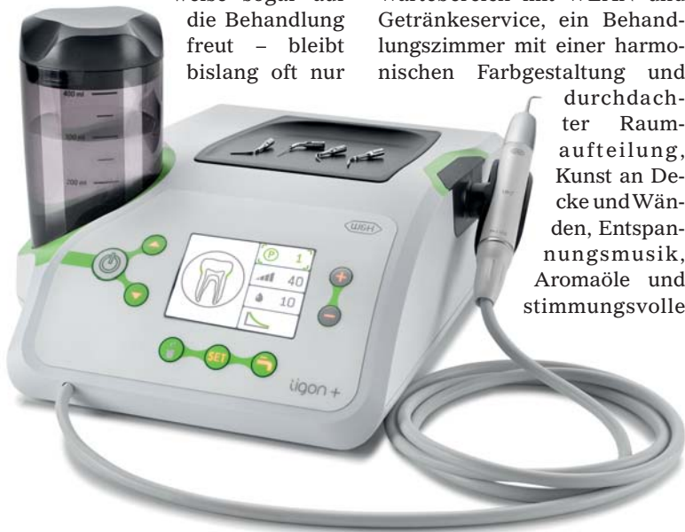
Abb. 1: Piezo Scaler Tigon+.

Für ein optimales Arbeiten der Spitzen sorgt nicht zuletzt die passende Ausleuchtung mittels LED. Ein fünffacher LED-Ring am Handstück leuchtet die Behandlungsstelle vollständig aus und verbessert damit die optische Wahrnehmung des Zahnarztes. Dadurch wird ein Kontrastsehen identisch dem Tageslicht ermöglicht und Arbeitsschritte wie die Bestimmung der Zahnfarbe gestalten sich problemlos und korrekt. Muss die Spitze während der Behandlung getauscht werden, wurde mit Tigon+ auch hierbei an besten Bedienerkomfort gedacht: Das Tray ist großräumig genug, um Instrumente während der Be-