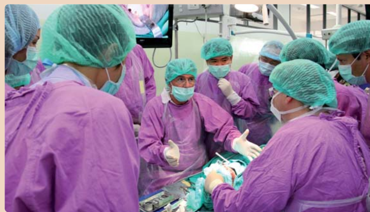
Die DGOI bietet mit dem Hands-on-Kursus an Humanpräparaten eine seltene Fortbildungsmöglichkeit mit großem Praxisnutzen.

DGOI veranstaltet Humanpräparatekursus in Bangkok.