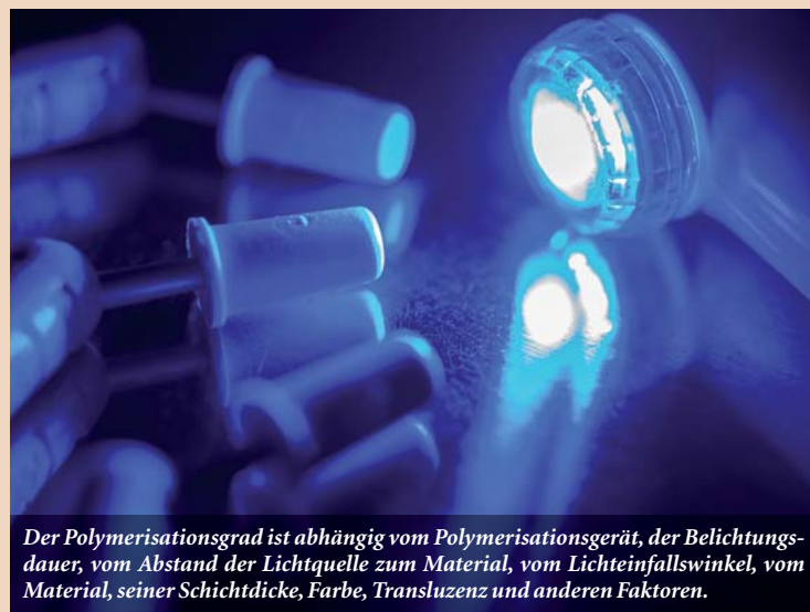
Der Polymerisationsgrad ist abhängig vom Polymerisationsgerät, der Belichtungsdauer, vom Abstand der Lichtquelle zum Material, vom Lichteinfallswinkel, vom Material, seiner Schichtdicke, Farbe, Transluzenz und anderen Faktoren.

Je nach individueller Prädisposition und Immunstatus können Komposite anscheinend zu sehr unterschiedlichen Symptomatiken beitragen bzw. führen – ähnlich einer Virusinfektion, auf die verschiedene Menschen ebenfalls mit sehr unterschiedlichen Symptomen und Verläufen reagieren können. Im Gegensatz zur Virusinfektion, die wir unter Umständen sehr adäquat z.B. durch Fieber selbst erfolgreich therapieren können, verursacht das dauerhaft inkorporierte Komposit permanenten, untherapierbaren Stress an derselben Stelle im Organismus – meist über Jahrzehnte.