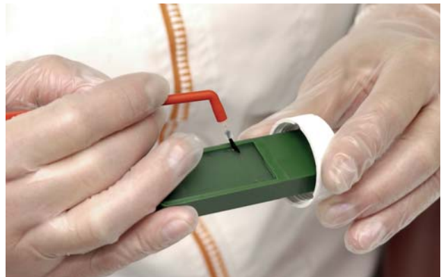
Abb. 1: Aufbringen von Plaque auf das Nährmedium des CRT bacteria Tests.

Strategien, die in bestimmten kritischen Phasen den Einsatz von Schutzlacken vorsehen, ermöglichen eine effektive Behandlung. Diese lässt den Besuch in der Zahnarztpraxis zum positiven Erlebnis werden und bildet damit die Basis für eine zukünftig enge Bindung. So gelingt die Kontrolle der Mutans-Streptokokken durch die Applikation eines chlorhexidinhaltigen Schutzlackes, wie zum Beispiel Cervitec Plus. 3,4 Der Vorteil besteht darin, dass der Lack professionell sowie gezielt und unabhängig von der Compliance aufgetragen wird (Abb. 2). Die Applikation geht schnell, da das Lacksystem bis zu einem gewissen Grad feuchtigkeitstolerant ist. Auch kleine Kinder akzeptieren die Behandlung sehr gut, wie die Praxiserfahrung zeigt. Klinische Studien belegen,