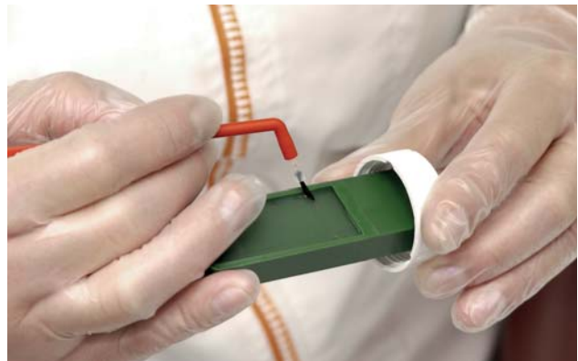
Abb. 1: Aufbringen von Plaque auf das Nährmedium des CRT bacteria Tests.

Strategien, die in bestimmten kritischen Phasen den Einsatz von Schutzlacken vorsehen, ermöglichen eine effektive Behandlung. Diese lässt den Besuch in der Zahnarztpraxis zum positiven Erlebnis werden und bildet damit die Basis für eine zukünftig enge Bindung. So gelingt die Kontrolle der Mutans-Streptokokken durch die Applikation eines chlorhexidin- und thymolhaltigen Schutzlackes, wie zum Beispiel Cervitec Plus. 3,4 Der Vorteil besteht darin, dass der Lack professionell sowie gezielt und unabhängig von der Compliance aufgetragen wird (Abb. 2). Die Applikation geht schnell, da das Lacksystem bis zu einem gewissen Grad feuchtigkeitstolerant ist. Auch kleine Kinder akzeptieren die Behandlung sehr gut, wie die Praxiserfahrung zeigt. Klinische Studien belegen,