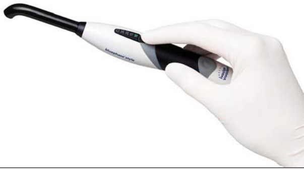
Abb. 5: Der verkürzte, drehbare Lichtleiter der Bluephase Style erleichtert im kleinen Kindermund das Polymerisieren von Füllungsmaterialien und Fissurenversiegeln.

dass die Lackapplikation eine wertvolle Alternative während des Zahndurchbruches darstellt, wenn eine Fissurenversiegelung kontraindiziert ist. 5