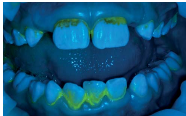
Abb. 6: Fluoreszierender Biofilm. Gut zu sehen bei eingesetztem flexiblen Lippen-Wangen-Halter.

Methoden, die das Thema Mundpflege spannend machen und fundierte Informationen für die Diagnostik liefern, sind erste Wahl für die Kinderbehandlung. Das Visualisieren des bakteriellen Biofilms mit einer fluoreszierenden Indikatorflüssigkeit, wie Plaque Test, lässt den Besuch zum interessanten Erlebnis werden (Abb. 6). Das Anlegen des flexiblen Lippen-Wangen-Halters OptraGate Junior macht nicht nur Spaß, sondern ermöglicht auch einen besseren Zugang zum