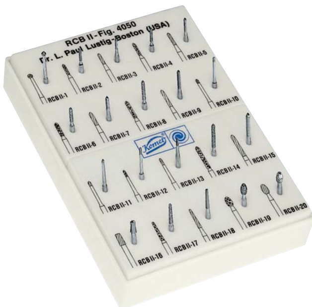
Abb. 1: Der RCB-Satz war der erste Schritt in eine systematische Präparationstechnik und die Abkehr von den kantigen Instrumenten- und Präparationsformen.