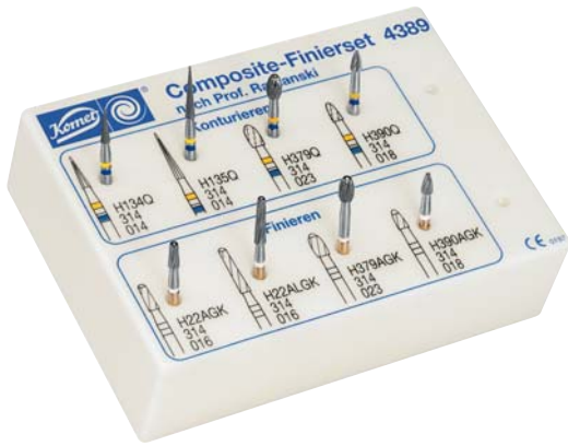
Abb. 3: Die Q-Finierer (wie hier im Compositefinieret 4389) waren scharf genug im Composite, aber aufgrund der Schneidekanten-geometrie ziemlich schadlos am Zahnschmelz.