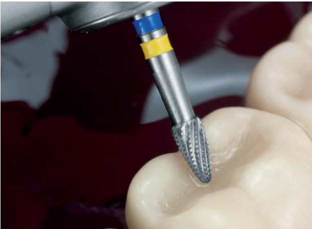
Abb. 2: Das sogenannte „Sapin System“, mit dem in kürzester Zeit eine Amalgamfüllung gestaltet werden konnte, enthielt u.a. den Hartmetall-Finierer H390.

Schritt schaffte, hochpräzise arbeitete und erstmals vollautomatisch aus einem Magazin bestückt wurde.“ Die Herstellung formkongruenter Instrumente sollte für lange Zeit ein Alleinstellungsmerkmal auf dem Markt bleiben.