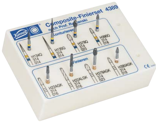
Abb. 3: Die Q-Finierer (wie hier im Compositefiniererset 4389) waren scharf genug im Composite, aber aufgrund der Schneidekanten-geometrie ziemlich schadloos am Zahnschmelz.