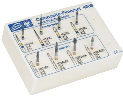
Abb. 3: Die Q-Finierer (wie hier im Compositefiniererset 4389) waren scharf genug im Composite, aber aufgrund der Schneidekanten-geometrie ziemlich schadlos am Zahnschmelz.