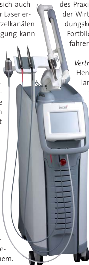
Der Lightwalker von Fotona, in Deutschland exklusiv bei Henry Schein.