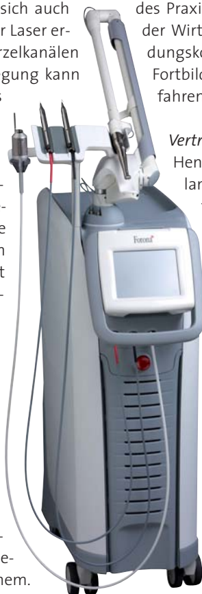
Der Lightwalker von Fotona, in Deutschland exklusiv bei Henry Schein.