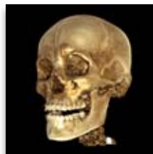
Planmeca ProMax 3D Max Ø230 x 260 mm