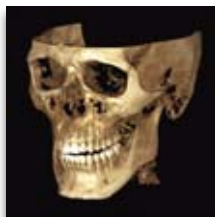
Planmeca ProMax 3D Mid Ø160 x 160 mm