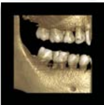
Planmeca ProMax 3D s Ø50 x 80 mm