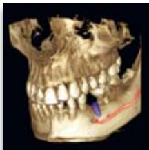
Planmeca ProMax 3D Ø80 x 80 mm