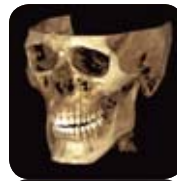
Planmeca ProMax 3D Mid