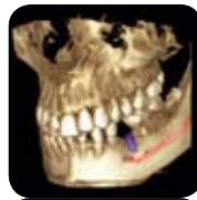
Planmeca ProMax 3D