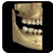
Planmeca ProMax 3Ds