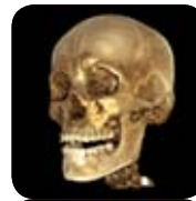
Planmeca ProMax 3D Max