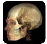
Planmeca ProMax 3D ProFace

Die einzigartige Kombination aus DVT Bild- und 3D- Gesichtsfoto