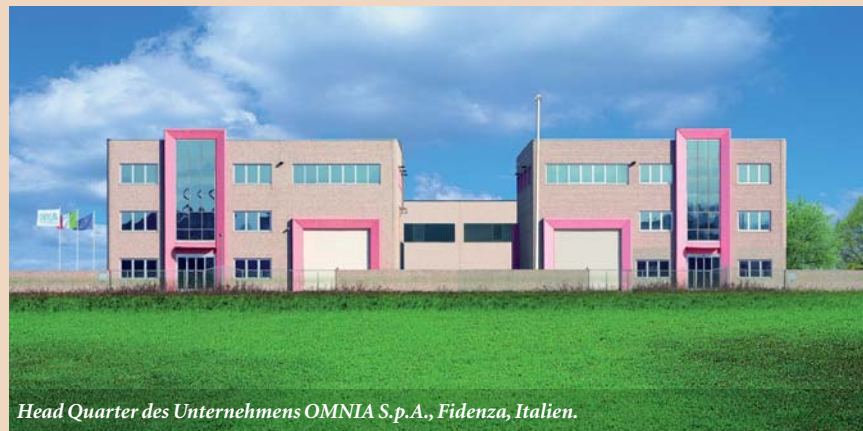
Head Quarter des Unternehmens OMNIA S.p.A., Fidenza, Italien.

teile sofort erkennbar, denn es entfallen alle Aufbereitungskosten hinsichtlich Waschen und Sterilisation. Auch das Personal wird somit entlastet und kann sich anderen Tätigkeiten widmen. Auch im Vergleich mit der Verwendung einzelner steril verpackter Einwegmaterialien mit dem individualisierten Set können sehr leicht verschiedene Vorteile gefunden werden, und zwar speziell in der Reduzierung der Lagerung, wo unterschiedliche Kartons durch einen einzigen ersetzt werden können. Dies bietet mehr Übersicht und erleichtert